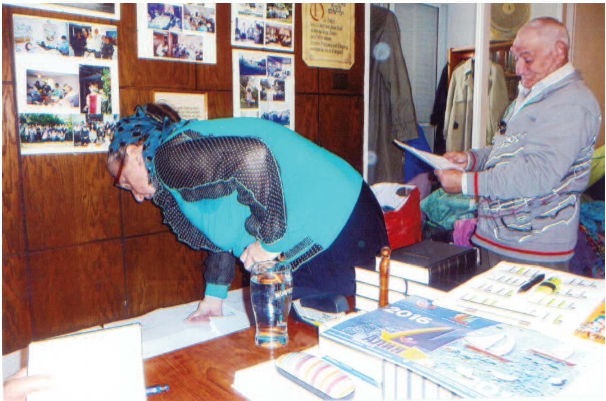
Anhand unserer theologischen Schriften und Büchern soll das Studium vertieft werden: