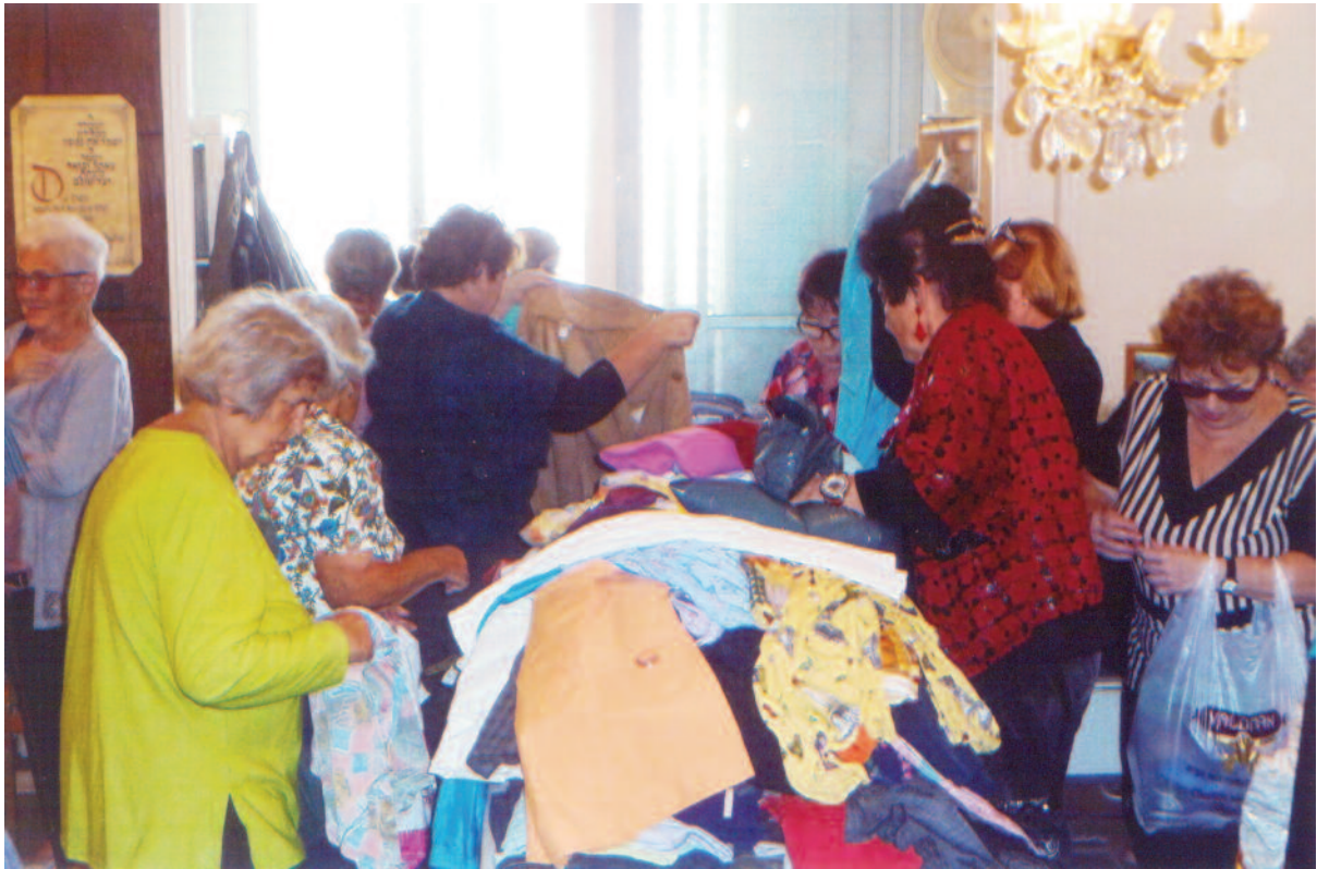
Dankbare Abnehmer bedienen sich vor der Schabbat-Versammlung: