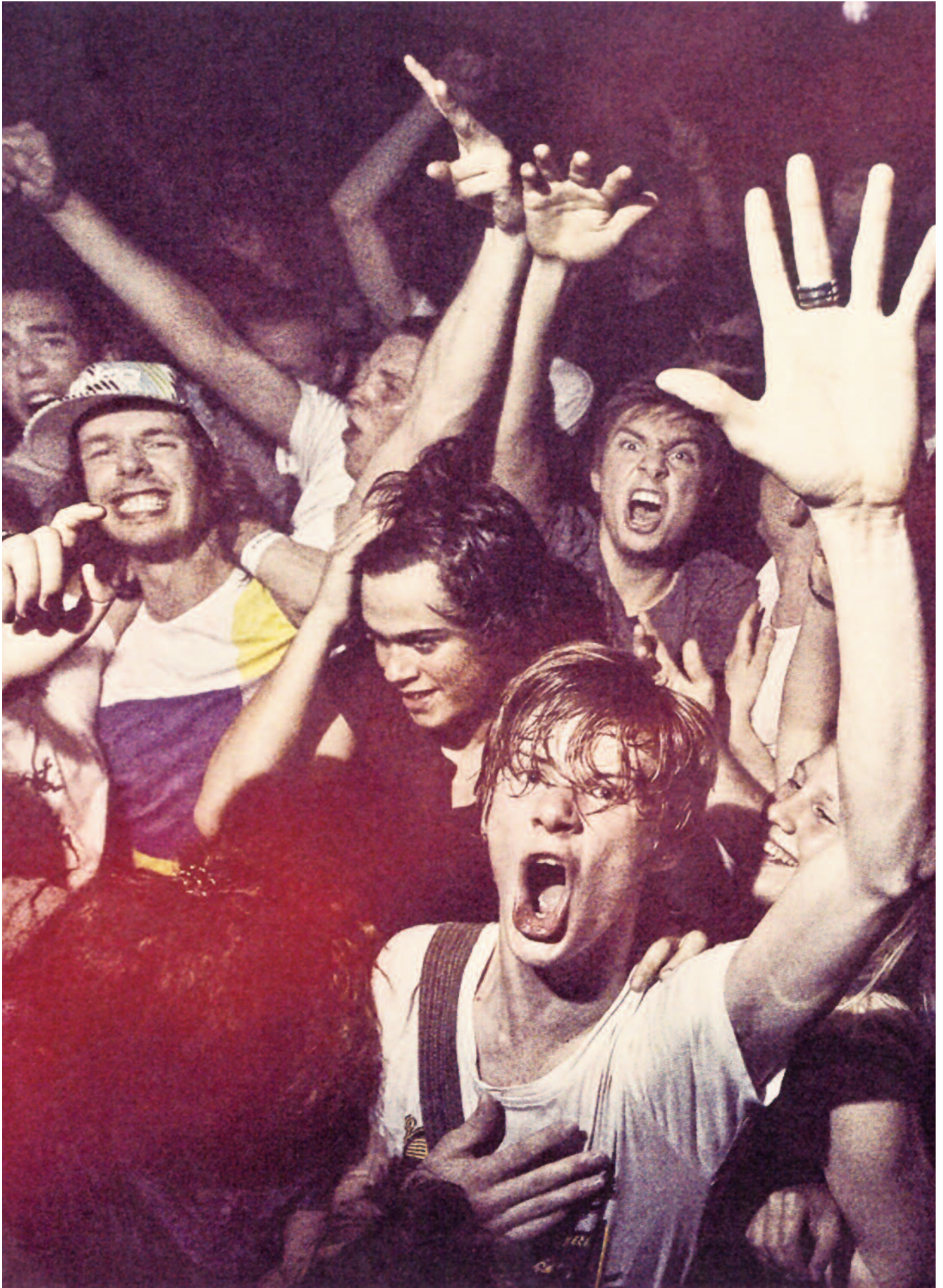
Eine zunehmend verahlroste Jugend, die ihren Lebenssinn in Parties und Hedonismus sieht, mu- tiert zu jener Generation, die man als antichristlich apostrophiert