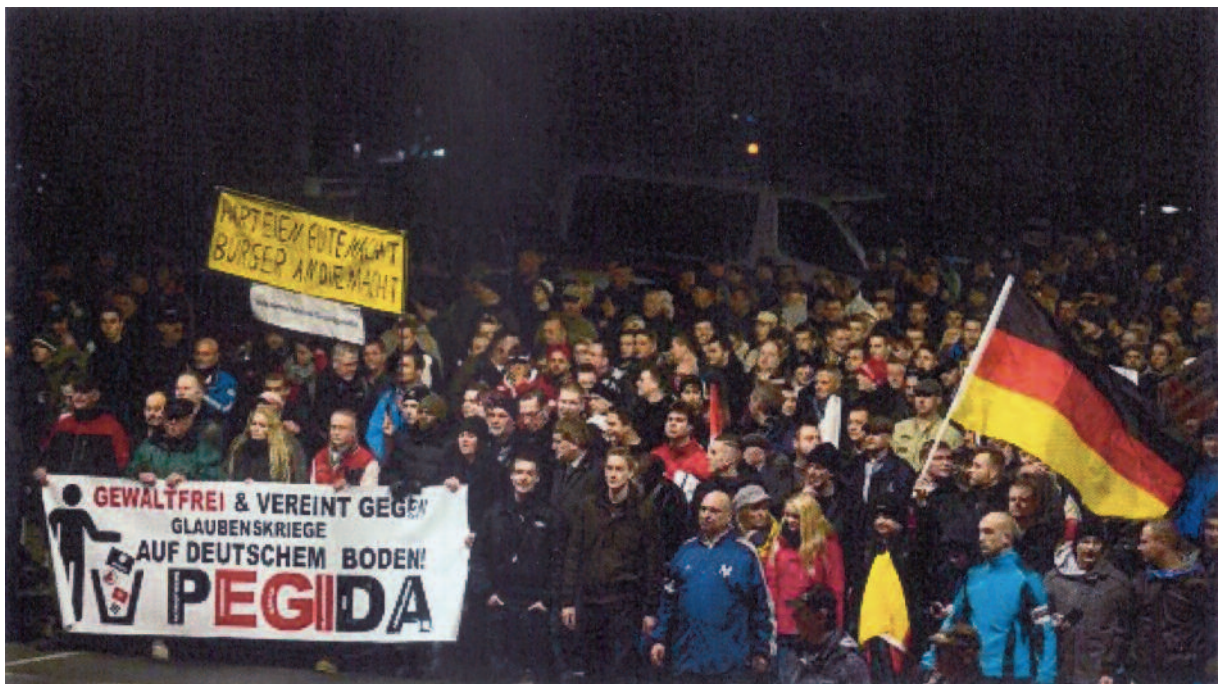
PEGIDA-Demonstranten fürchten eine Islamisierung Deutschlands. Bei Antipegida-Demonstrationen rüsten sich muslimische Agitatoren bereits zum Gegenangriff auf deutschen Straßen

Abgesehen davon, daß diese unreflektierten Beurteilungen deutscher Politiker eine Desavouierung von Tausenden Bürgern