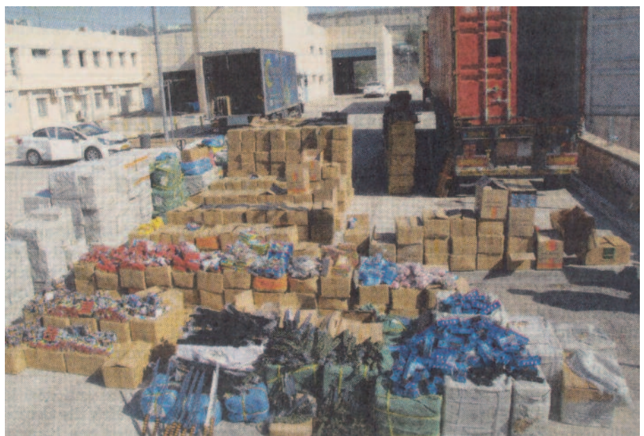
Eine ganze Schiffsladung mit Waffen wurde im Hafen von Aschdod aufgegriffen, die für die Palästinenser in der Westbank bestimmt waren

Kurz vor Jahresende 2014 griffen zwei jugendliche Palästinenser in der Westbank ein vorbeifahrendes Auto mit israelischem Kennzeichen mit einem Molotowcocktail an. Dabei erlitt