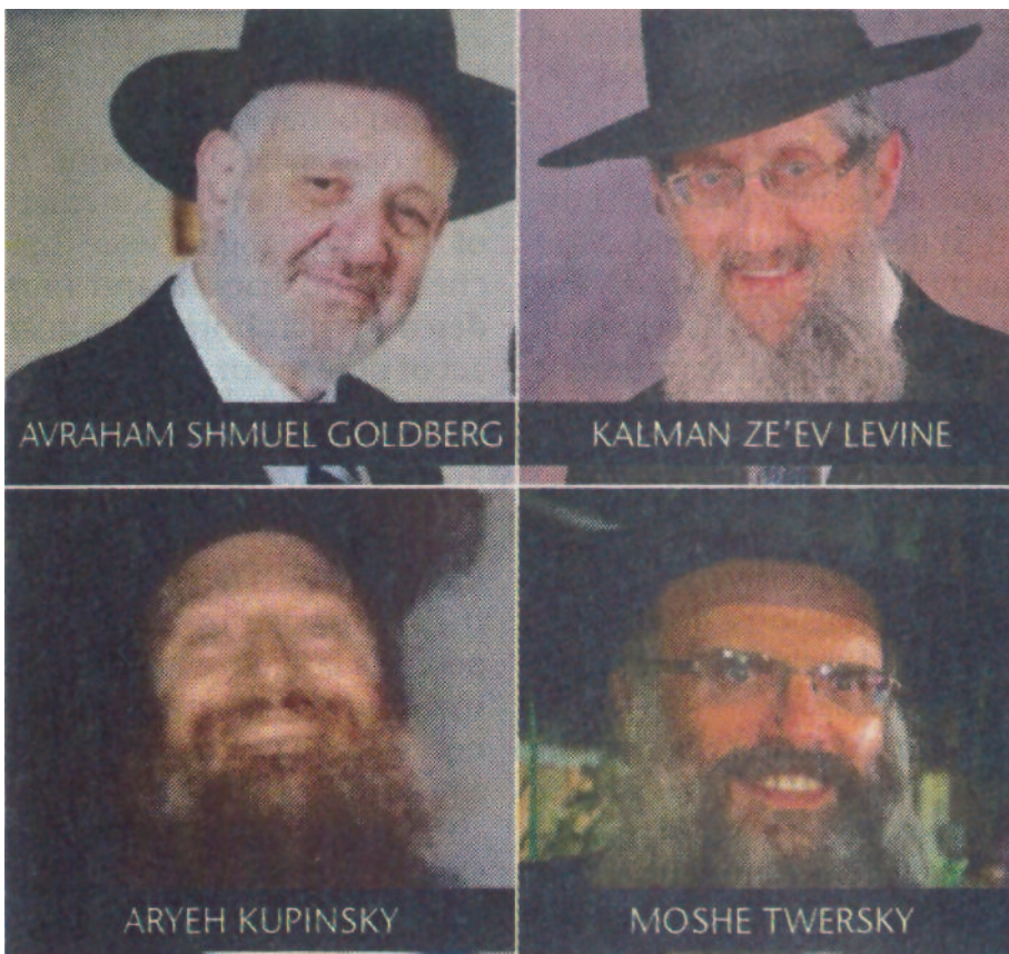
Vier Rabbis wurden auf brutalste Weise von palästinensischen Salafisten niedergemetzelt

In biblisch inspirierten Festgewändern ehren jüdische Tempelpriester, Leviten und Kohanim, bereits die heilige Stätte. In einem „Tempel-Institut“ realisiert man bereits diesen großen Traum vieler Juden: den Wiederaufbau ihres wichtigsten Heiligtums, des Tempels von Jerusalem, der im Jahre 70 n.Chr. von den Römern zerstört wurde. Etwa 20 ultraorthodoxe und nationalstische Gruppierungen sind Teil