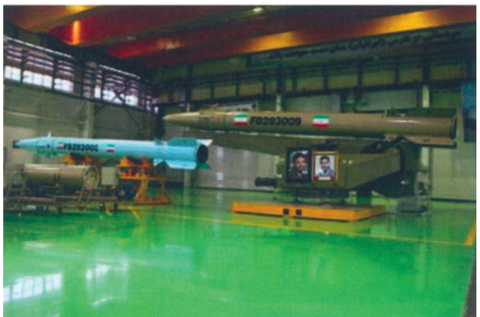
Iranian Fateh-110 rocket