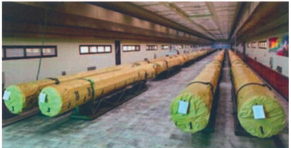
Iranian Qader and Qiam rockets