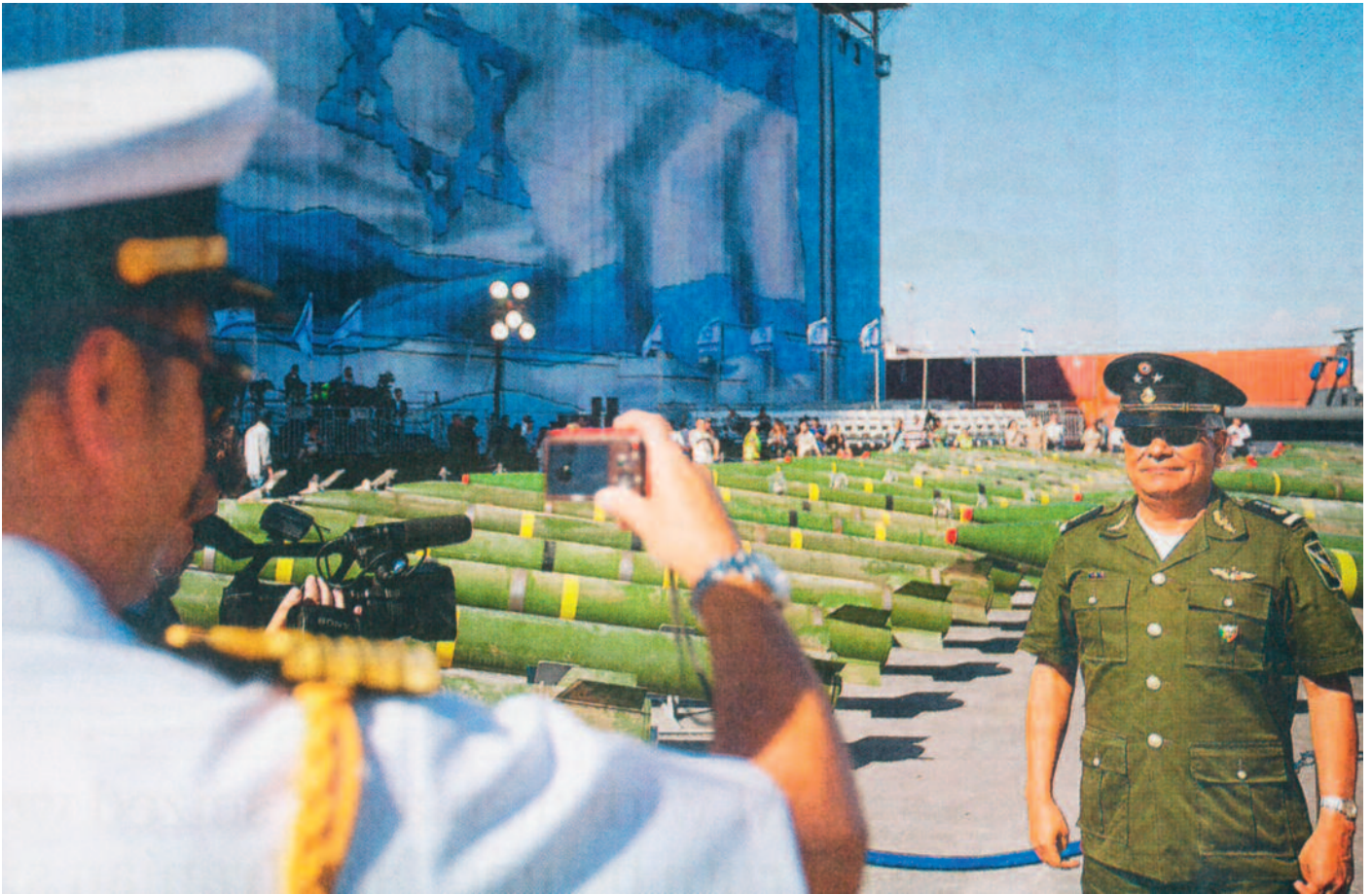
Blick auf die M-302-Raketen, die auf dem Schmuggelschiff "Klos C" zur Terrorgruppe "Chamas" in den Gazastreifen verbracht werden sollten