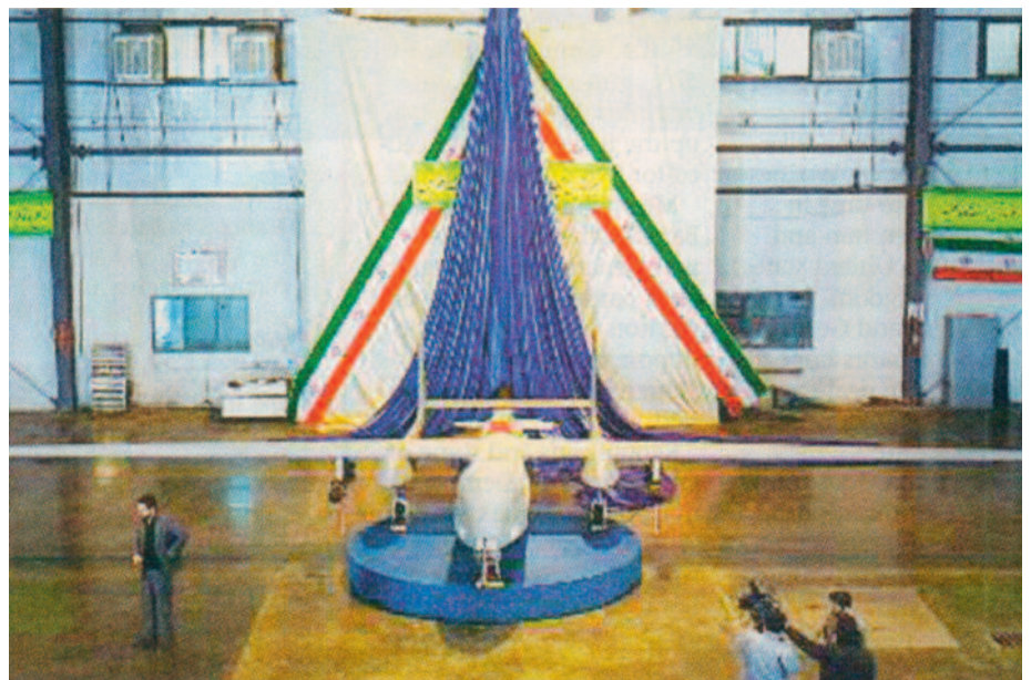
In Teheran wurde die neue Drone namens „Fotros“ vorgestellt, die nicht nur als unbemanntes Aufklärungsflugzeug über israelisches Gebiet eingesetzt werden soll, sondern auch mit Bomben ausgestattet werden kann

So ist es eine Farce, wenn einerseits Moskau gegen Islamisten auf seinem Territorium Krieg führt, und andererseits auswärtige Terroristen, die „im Namen Allahs“ die Welt erobern wollen, mit hochmodernen Waffen ausgestattet. Denn es ist ebenso kein Geheimnis, daß solche Waffen bis in den Gazastreifen gelangen und gegen den Staat Israel eingesetzt werden. Bei allen Interim-Abkommen mit dem Iran mußte bis heute der Iran keine einzige Zentrifuge zur Urananreicherung eingestehen. Dabei schießt sich der Westen zunehmend auf Israel als den eigentlichen Friedensstörer ein. Denn die internationale Staatengemeinschaft, respektive die Verhandlungspartner P5+1 USA, Rußland, China, England, Frankreich und Deutschland, wissen über den Iran und seinen Aktivitäten nur so viel, wie sie von den Iranern erfahren, wobei Rußland als deren Waffenlieferant mehr darüber weiß als die anderen