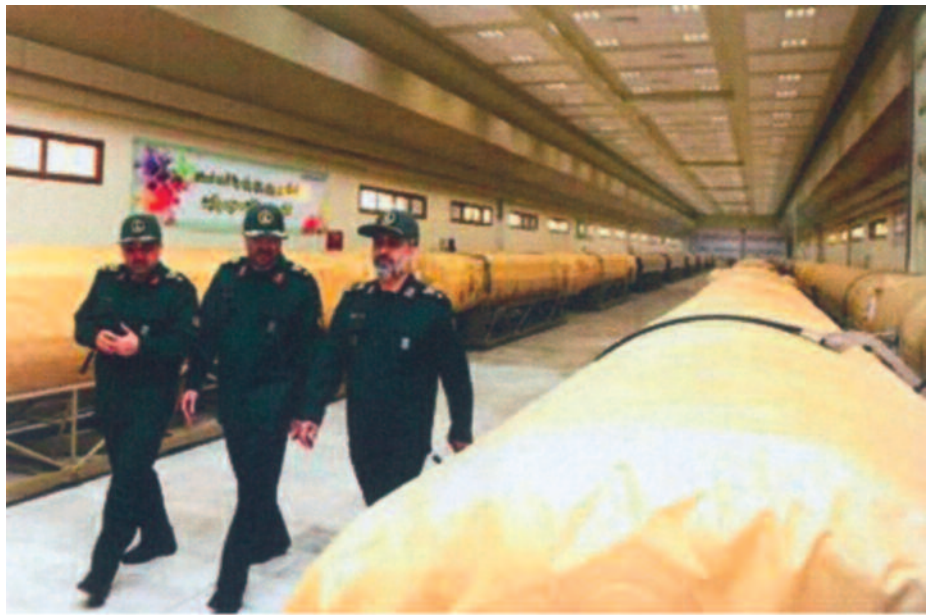
Iranian Qader rocket

Israel macht angesichts der drohenden Gefahr aus dem Iran die bittere Erfahrung, daß seine Hilfe in der Staatengemeinschaft auf taube Ohren stößt. Schließlich ist es nicht das erste Schiff, was mit einer Ladung gefährli-