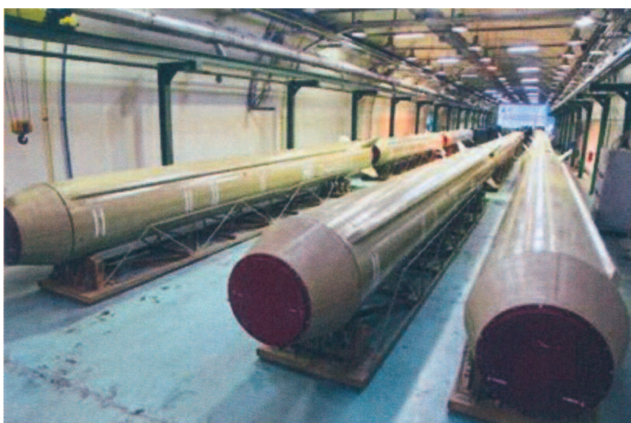
Iranian Qader rocket

cher Waffen von den Israelis aufgegriffen worden war. Ich erinnere dabei an die „Karine A“ im Januar 2002, die 50 Tonnen Waffen und Munition transportiert hatte. Damals steckte Yassir Arafat hinter dieser Aktion. Doch der Hauptgegner dieser Tage ist nun einmal der Iran. Premier Netanjahu sieht es als seine Lebensaufgabe an, diesem Gegner das Handwerk zu legen. Aber alle seine Warnungen stoßen bei den Nationen auf Unverständnis, zumal alle Aufmerksamkeit auf die Ereignisse in Rußland und der Ukraine gerichtet sind, die