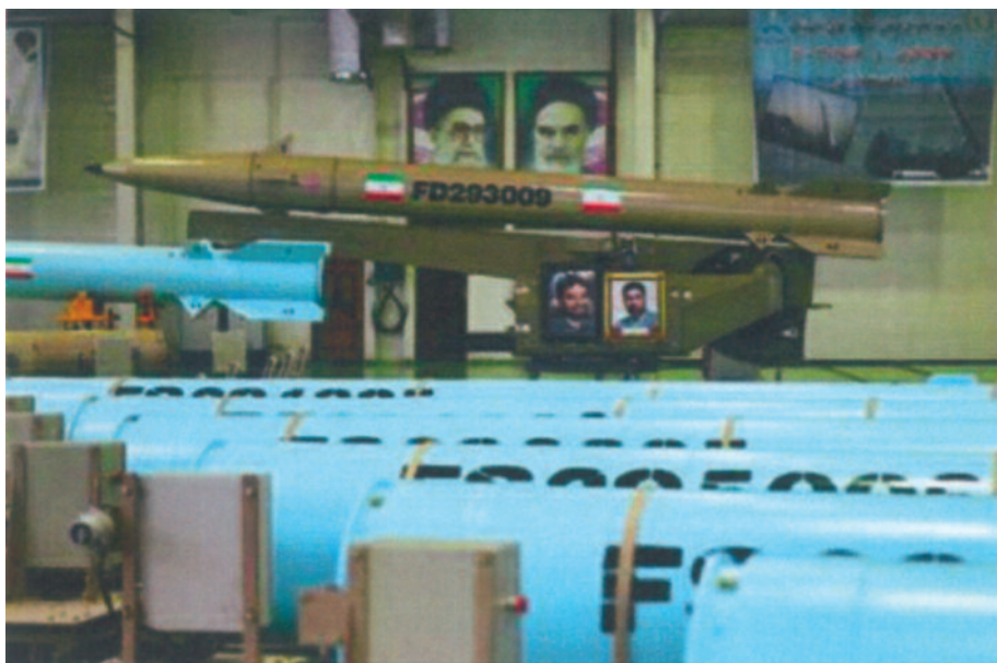
Iranian Fateh-110 rocket