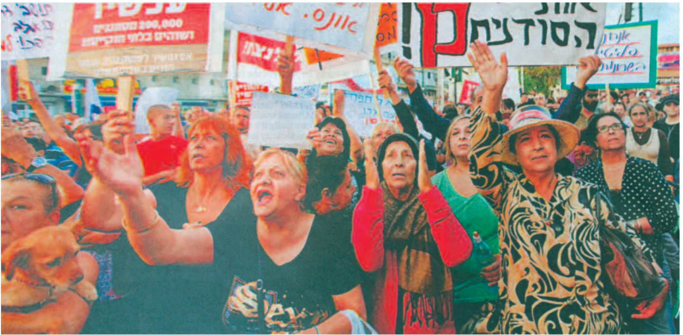
Eintausend Demonstranten protestierten lauthals im Süden Tel Avivs gegen den Zustrom von afrikanischen Infiltranten. Die Menge schlug Fenster ein, auch von vorbeifahrenden Autos.

bedroht fühlt. Zu den mannigfachen außenpolitischen Problemen kommen nun auch solche innenpolitische hinzu. Es ist keine Frage, daß dieses kleine Land mit seiner Bürde, zehn Prozent seiner ultraorthodoxen Juden durchfüttern zu müssen, nun auch zu einem Einwanderungsland für afrikanische Flüchtlinge zu werden, bedeutet eine Überforderung des Staates Israel, zumal die illegalen Einwanderer ein Sicherheitsrisiko für die Einwohner Israels sind. Frauen bedeuten für sie Freiwild. Ihr Bildungsstand ist gleich Null.