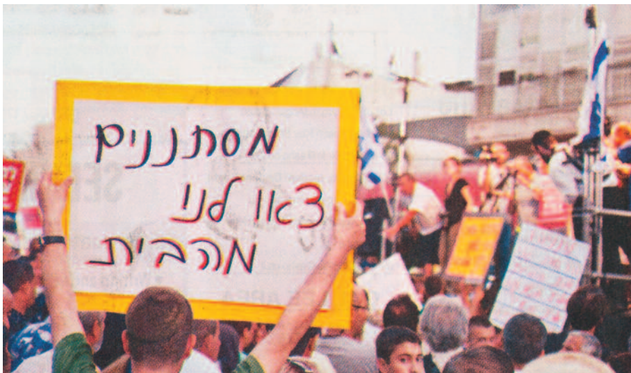
Auf dem Plakat heißt es: „Infiltranten, verlaßt unser Heim!“

portieren sind. Hinzu kommen noch 35.000 Flüchtlinge, die von sich behaupten, wegen Lebensgefahr nicht mehr in ihre Heimat zurückkehren zu können. Der muslimische Nordsudan unter dem Diktator Baschir, der mit internationalem Haftbefehl gesucht wird, gilt als Feind Israels. Im südlichen Teil, wo auch die Ölquellen liegen, leben vornehmlich christliche Sudanesen, die unter der Oppression aus dem Norden leiden. Allerdings nimmt Israels ultraorthodoxer Innenminister von der SCHAS-Partei, Eli Ischai, auf solche Einwände keine Rücksicht und möchte auch die Sudanesen aus dem (christlichen) Süden ausweisen. Er räumte ihnen eine Woche ein, um Israel zu verlassen. Migranten, die sich damit einverstanden erklären, erhalten 1000 Euros und ein Flugticket. Wer von diesem Angebot keinen Gebrauch macht, wird festgenommen und zwangsweise deportiert. Es handelt sich dabei um 35.000 Migranten aus Eritrea und 15.000 aus dem Sudan. Ischai möchte auf diese Weise seinen Einlassungen zufolge den „jüdischen Traum“ von der eigenen Heimat retten.