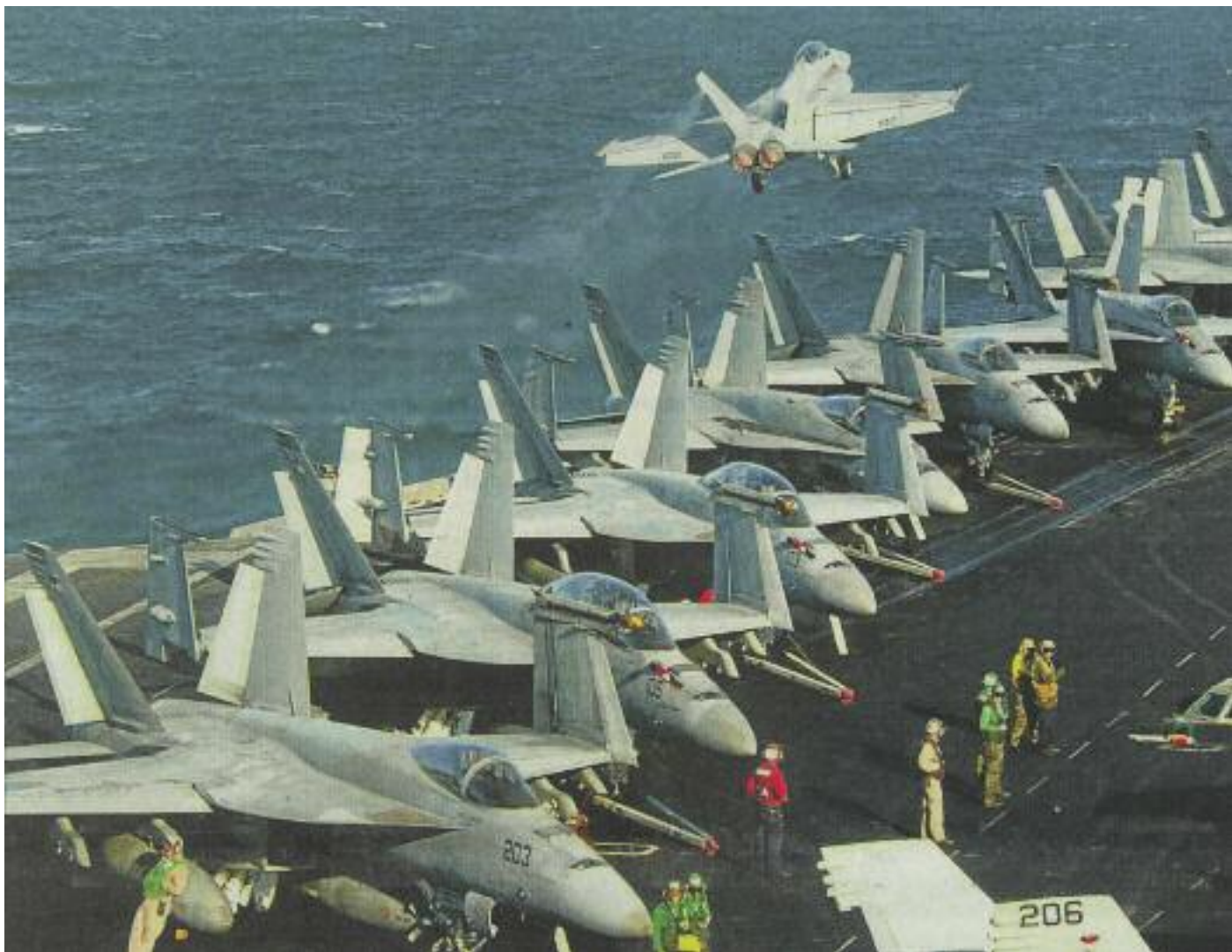
Im Persischen Golf - Kampjets auf dem amerikanischen Flugzeugträger USS John C. Stennis

zweilichtigen Spiel der beiden Großmächte Rußland und China keineswegs zu überschätzen. Und die Selbstsicherheit des Auftretens Teherans rührt nicht zuletzt daher, daß es diese beiden insgeheim hinter sich weiß – und einen schwächelnden Obama, der in diesem Jahr mit seiner Wiederwahl beschäftigt ist und dabei auch vom ohnehin ungeliebten Netanjahu keinesfalls gestört werden möchte, nicht ganz ernst zu nehmen braucht. So könnte sich letztlich eher herausstellen, daß gerade Amerika, dem die Welt die jüngste Weltwirtschaftskrise hauptsächlich zu verdanken hat, zunehmend unter Druck gerät – und damit auch der „kleine Bruder“ im Nahen Osten, Israel. Und ohne Go-ahead des großen Bruders aus Übersee