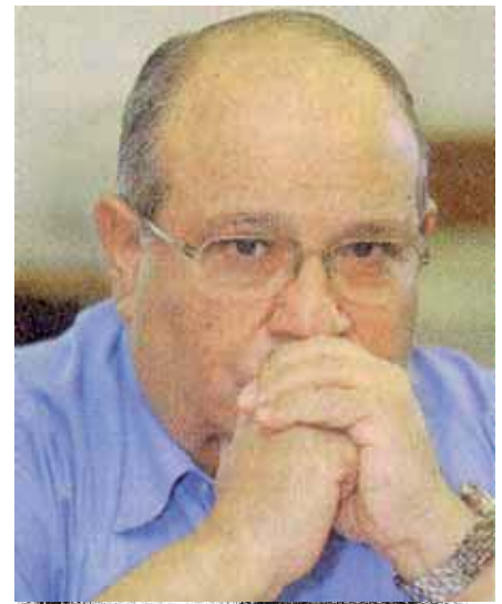
Der bisherige MOSSAD-Chef Meir Dagan wird abgelöst