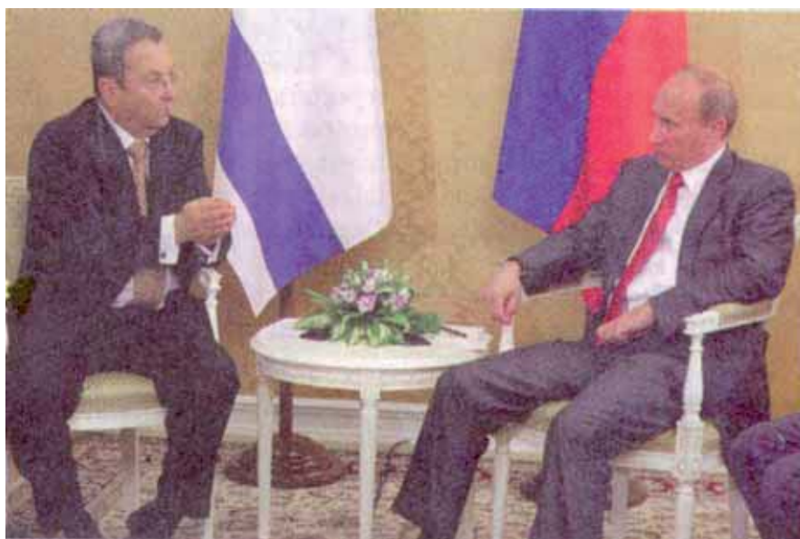
Mit der Lieferung von hochmodernen Waffensystemen versucht Israels Verteidigungsminister Ehud Barak die Gunst Wladimir Putins zu erwerben

gen Dronen trainiert, die möglicherweise einmal gegen Israel eingesetzt werden. Wie kann man mit dem Feind von morgen und dem Freund seiner Feinde ein Joint-Venture-Abkommen für hochsensible Waffensysteme abschließen? Es versteht sich, daß sich Moskau dafür sehr interessiert zeigte. Es liegt auf der Hand, daß die Russen solche Waffensysteme nachbauen werden und damit Israels Feinde (Iran und Syrien und sogar Hisb-Allah) beliefern werden. Schließlich erhielt Syrien zum gleichen Zeitpunkt aus Moskau die modernsten supersonic P-800 Yakhont Cruise Missiles-Raketen. Im Zweiten Libanonfeldzug hatte damit die Hisb-Allah die israelische Korvette „Hanit“ versenkt. Israel irrt, wenn man in Jerusalem kalkuliert, daß man auf diese plumpe Weise die Gunst der russischen Militärs kaufen könnte. Offensichtlich geht es den Israelis um Geld aus Moskau, auch wenn es den Interessen eines potentiellen Feindes und seinen Proxies dient. Naiv erläuterte Barak diesen Deal mit der Bemerkung: „Sicherheit hat bei uns oberste Priorität. Wir wollen in Sachen der Sicherheit Israels keine Kompromisse eingehen!“