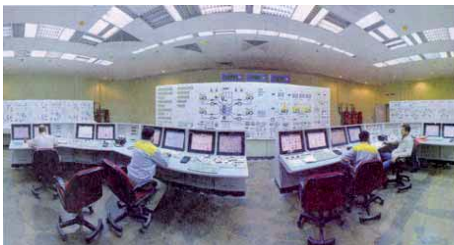
Die iranische Reaktor-Anlage im iranischen Buschehr arbeitet seit Oktober des Jahres auch mit Hilfe russischer Kollegen

für den ganzen Mittleren Osten nach sich ziehen würde. Andererseits hält er die Entwicklung einer Atomwaffe im Iran für unakzeptabel. Mullen räumt ein, daß die USA auch militärische Optionen ins Auge fassen. Als Reaktion darauf war vom stellvertretenden Leiter der Revolutionsgarden Jaddollah Javani zu hören, daß für einen solchen Fall der Iran den gesamten Persischen Golf zum Angriffsziel mache, was dann den gesamten Erdöl-Transport aus den arabischen Förderländern in die westlichen Staaten zunichte machen würde. Sollten hier die USA den kleinsten Fehler begehen, wäre die Sicherheit der gesamten Region gefährdet, heißt es dazu aus Teheran. Doch Angst ist ein schlechter Berater (hebr.: pachad jo'etz ra). Ungeachtet dieses Dilemmas bleibt die Frage offen, ob Israel nun wie ein Karnickel auf den tödlichen Gennickschlag wartet oder sich zuvor präventiv dagegen zur Wehr setzt. US-Präsident John F. Kennedy sagte im Jahre 1961 im Zu-