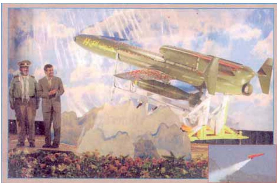
Irans Präsident Achmadinejad applaudiert bei der Vorstellung einer „Karrar“-Rakete als „Botschafter des Todes“ für die Feinde Irans und meint dabei Israel

Für den Transport problematischer Güter verwendet Teheran Firmen auf Malta. Allein in Natanz arbeiten 6.000 Zentrifugen zur Anreicherung von Uran. Sanktionen gegen Iran spielen den Staat in russische und chinesische Hände. Mitte August kam es zu einem Treffen zwischen dem iranischen Ölminister Masud Mir-Kazemi und seinen chinesischen Partnern in Peking. Hingegen sorgen die russischen staatlichen Firmen OAO Rosneft und OAO Gazprom Neft für ausreichenden nuklearen Brennstoff zum Betrieb der Atomanlagen. Diese beiden Länder haben seit Jahren großes Interesse an Handelsbeziehungen mit dem iranischen Regime. Dabei denkt China auch an die eigene Versorgung für den Treibstoff der zunehmenden Motorisierung seiner Bürger. So dienen letztendlich Sanktionen des Westens gegen den Iran für einen verstärkten Absatz von Erdöl und Erdgas an China und Schwellenländer. Rußland selbst sieht im Iran und seinen Satelliten, wie Syrien, Libanon und Chamas, eine gute Absatzmöglichkeit für seine Waffenproduktion. Chinas Vizeministerpräsident Li Keqiang gibt offen zu, daß der Iran der Haupt-Wirtschaftspartner Chinas ist. Im Juli des Jahres importierte der Iran aus Mangel an eigenen Raffinerien 60.000 Barrels Treibstoff täglich, verglichen mit 120.000 Barrels im Mai ins Land. Dabei drängt Teheran die Chinesen, in den Bau eigener Raffinerien zu investieren, um das eigene