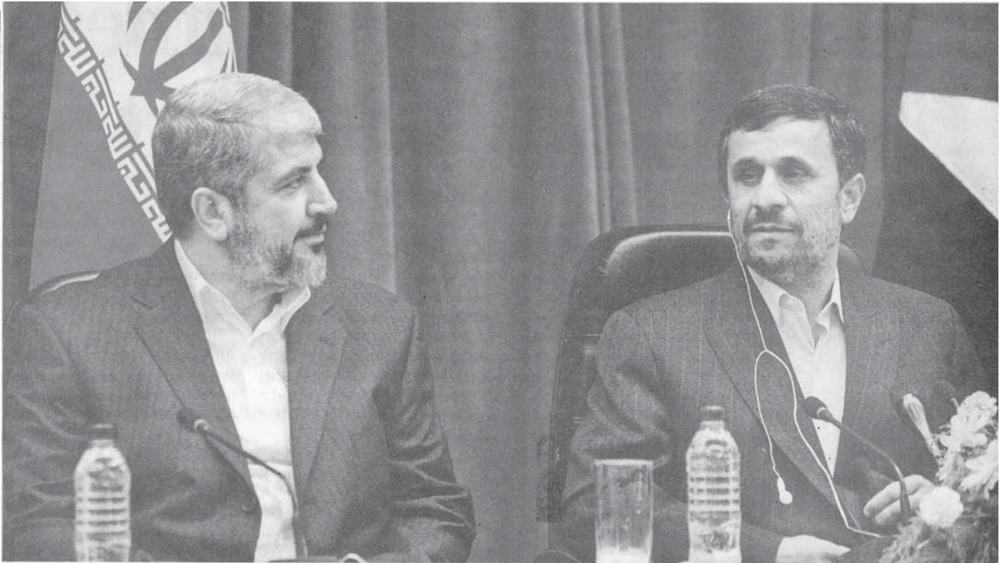
Mahmud Achmadinejad sitzt anlässlich einer Konferenz in Teheran einträchtig neben dem Chamas-Führer Chaled Mascha'al, dem Drahtzieher des Terrors

Hin und wieder zerstört Israel Tunnel-Anlagen im Süden des Gazastreifens, durch den sogar Raketen und Kühe geschmuggelt werden.