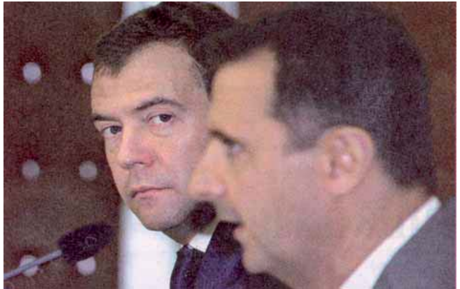
Rußlands Präsident Medvedev verhandelt mit seinem syrischen Waffenbruder Baschar el-Assad

Man erkennt dies auch daran, daß trotz der Verärgerung der israelischen Regierung Wladimir Putin daran festhält, den Iran und auch Syrien als „strategische Partner“ weiterhin mit Waffen zu beliefern. Dies bezieht sich vor allem auf die Lieferung von Langstreckenraketen des Typs Cruise Missile auf See. Putins Berater Sergij Prikhodko betonte ausdrücklich, daß sich Rußland an sämtliche Lieferverträge halten wird, auch wenn solche Waffen an die Terror-Organisation Hisb-Allah weitergegeben werden. Diese Raketen sind auf jeden Fall eine Gefahr für die israelische Marine und Häfen, wie Haifa und Aschdod. Mehr noch: es ist davon auszugehen, daß Rußland den Syrern ebenfalls zu einem Atomreaktor verhelfen wird – und dies vor der Haustür Israels. Sowohl die Türken als