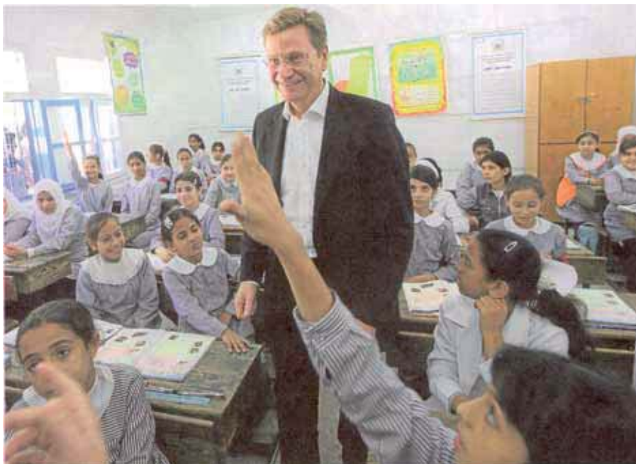
Deutschlands Außenminister Guido Westerwelle besuchte eine Mädchenklasse in Gaza. Für ihn sei die Blockade der dortigen Bevölkerung durch die Israelis „inakzeptabel“

Doch ungeachtet dessen geht der Waffenschmuggel über umfangreiche Tunnelanlagen in den Gazastreifen von der ägyptischen Grenze aus weiter, die von Zeit zu Zeit von israelischen Kampfflugzeugen teilweise zerstört werden. Die ägyptische Grenzpolizei beschlagnahmte Ende August annähernd 200 Raketen nebst dazugehöriger Munition, die in den Gazastreifen geschmuggelt werden sollten. So war der Besuch des deutschen Außenmini-