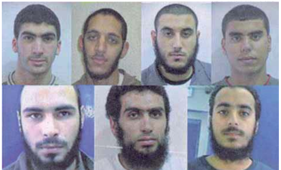
Diese Gruppe von Israelo-Arabern aus Nazareth plante spektakuläre Anschläge in Israel gegen Juden und Christen

Chamas-Chef Chaled Mascha'al warnt zudem, noch weitere israelische Soldaten kidnappen zu wollen, wie dies Gilad Schalit ergangen ist, der noch immer von der „Chamas“ im Ga-